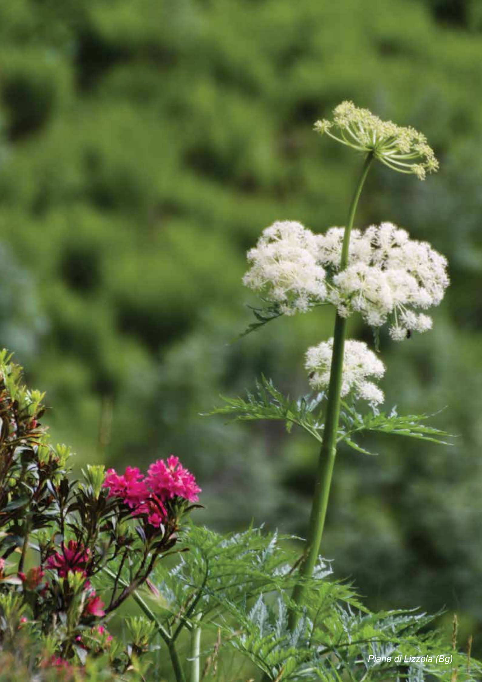
Piane di Lizzola (Bg)